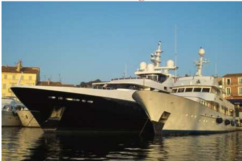
ទូកយ៉ាកប្រណិត

yacht n.m. យ៉ាក (ទូកកំសាន្តប្រើក្លោងវីម៉ូត័រ) → cabin-cruiser, cruiser; bélouga, finn, vaurien.