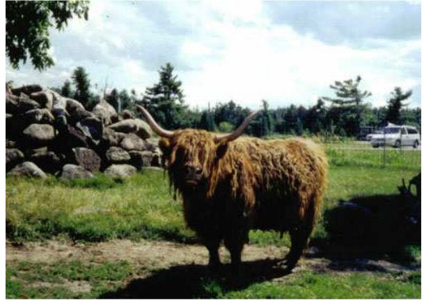
ក្របីយ៉ាក់

yakuza, yakusa n.m. (ជប៉ុន) យ៉ាកុសា (សមាជិកក្រុមសង្គមងងឹតជប៉ុន ប្រៀបដូចពួកម៉ាផ្យាដែរ)